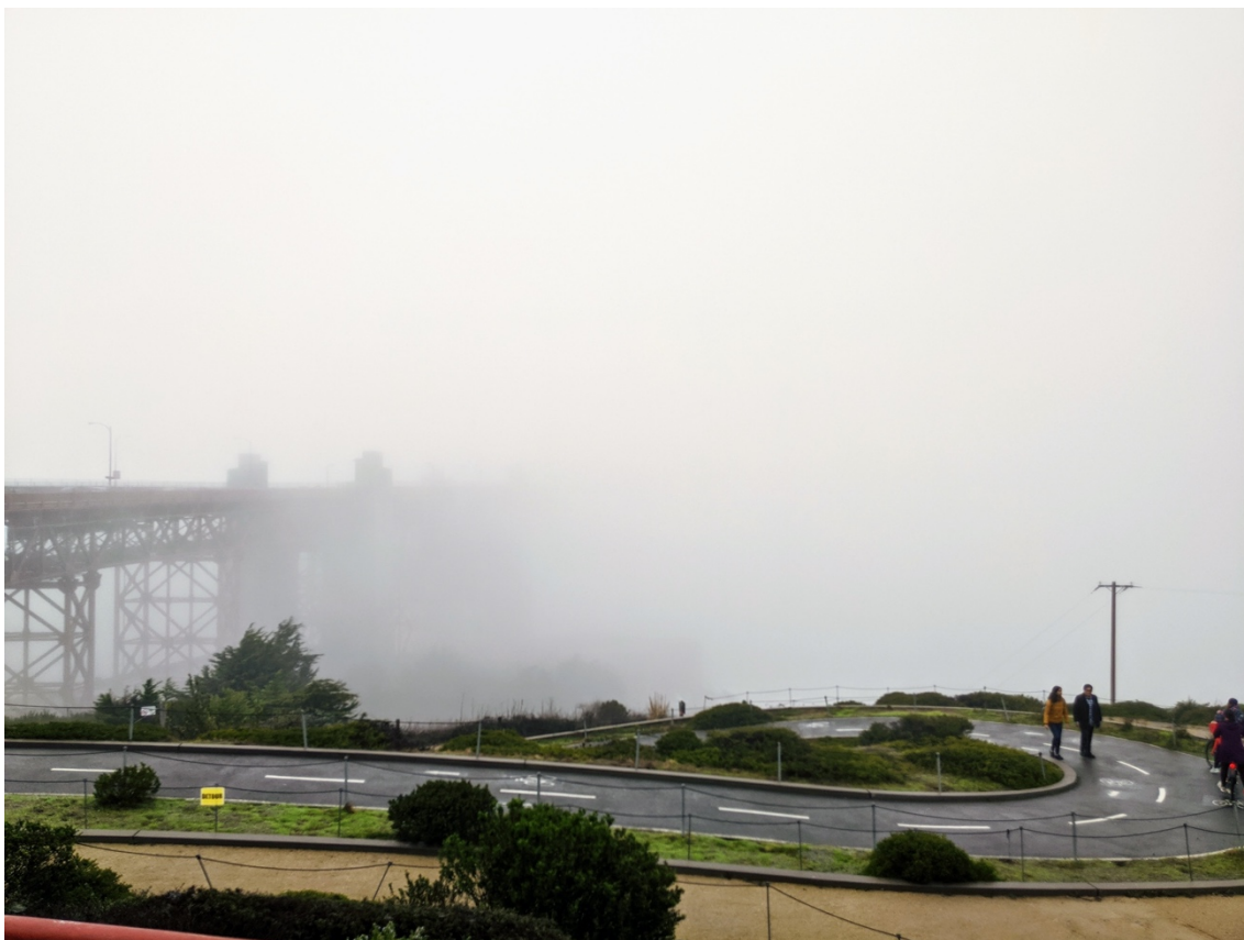
Fig. 2. The Golden Gate Bridge in the fog.